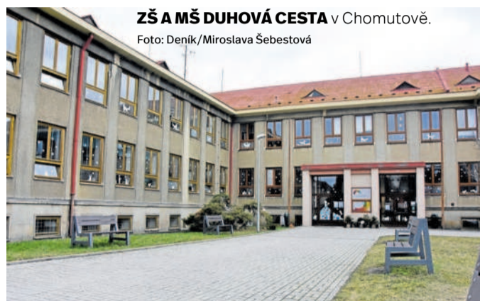
ZŠ A MŠ DUHOVÁ CESTA v Chomutově.

„Ukážeme si s kolegy metody, které se nám osvědčily, tvoříme myšlenkové mapy, učíme kritické myšlení a hodně stavíme na kooperativní výuce. To znamená, že jsou děti už od prvního stupně schopné spolupracovat a plnit složitější zadání,“ nastínila ředitelka, čím se „Duhovka“ liší od jiných škol. „Zavedli jsme také badatelskou výuku. Děti baví, že si mají na věci přicházet samy, učitel je spíše průvodcem,“ doplnila.