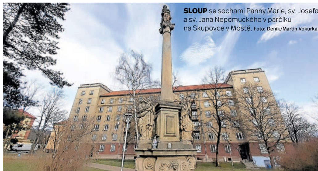
SLOUP se sochami Panny Marie, sv. Josefa a sv. Jana Nepomuckého v parčíku na Skupovce v Mostě.

Sloup nejprve obklopí lešení a před zahájením restaurátorských prací dorazí experti projednat technologické detaily. Práce začnou možná už v dubnu a měly by